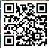
Котельная в московском микрорайоне Саларьево (видео)